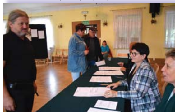
Lokal wyborczy i wybory w Łapanowie