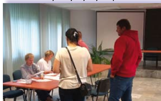
Lokal wyborczy i wybory w Raclawicach