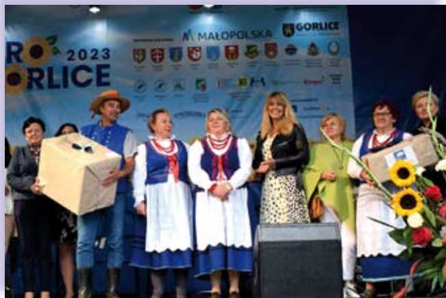
KGW nagrodzone w konkursie „Wypiek Regionalny Ziemi Gorlickiej”