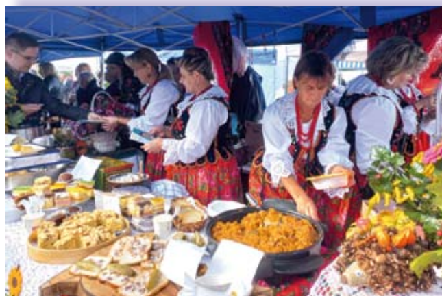
Feria barw i smaków – panie z lokalnych KGW zapewniły uczestnikom święta wyjątkową ucztę

Wydarzenie było okazją do zaprezentowania się przez różnego rodzaju instytucje okołorolnicze i lokalne stowarzyszenia, a także małe firmy z okolicznych miejscowości. Jednak nieodłącznym elementem Święta Ziemniaka są barwne i „smakowite” stoiska przygotowane przez lokalne koła gospodyń. Prezentacja potraw, napojów i nalewek, a także rękodzieła ludowego przyciągnęła uwagę gości. W programie znalazła się także prezentacja o zawrót głowy członków jury, których zadaniem był wybór najlepszej potrawy, napoju i rękodzieła.