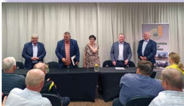
Spotkanie z przedstawicielami Wielkopolskiej IR

Wieczorem odbyło się spotkanie z przedstawicielami Wielkopolskiej Izby Rolniczej. Małopolanie mieli okazję poznać problemy tamtejszych rolników, a także ich sukcesy i nowatorskie rozwiązania zastosowane w produkcji rolnej. Z kolei Wielkopolanie, w trakcie ożywionej dyskusji, zapoznali się ze specyfiką małopolskiego rolnictwa.