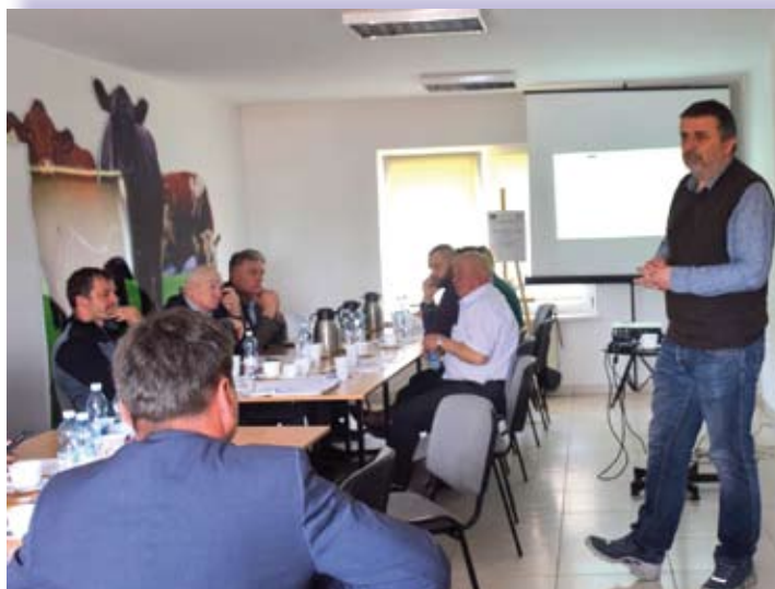
Szkolenie w Nowym Sączu, 29.05.2023 r.

Realizacja operacji jako działania pilotażowego wykazała duże zainteresowanie rolników tematyką związaną z dostępnością informacji o sposobach zarządzania wodą dostępną dla potrzeb rolniczych w tym jej retencjonowania, zapobiegania szkodom powstającym w skutek nadmiernej podaży lub niedoborów wody dostępnej dla roślin i zwierząt szczególnie w newralgicznych okresach ich rozwoju. Brak dostatecznej informacji w tym zakresie oraz niejednokrotnie znaczny stopień komplikacji wymuszający zapoznanie się z dużą ilością dokumentów prawnych regulujących kwestie związane z melioracjami, retencją wód na terenach rolniczych, możliwością pozyskiwania