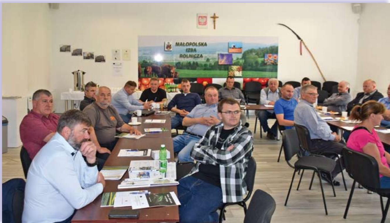
Szkolenie w biurze MIR w Tarnowie, 26.05.2023 r.

W trakcie szkoleń rolnicy mogli wysłuchać wykładu przeprowadzonego przez pracownika naukowego Uniwersytetu Rolniczego w Krakowie, gdzie zapoznani zostali z podstawowymi informacjami z zakresu sytuacji klimatyczno-hydrologicznej Europy, Polski oraz województwa małopolskiego, sposobów zarządzania wodami opadowymi w tym małej retencji oraz oszczędnego,