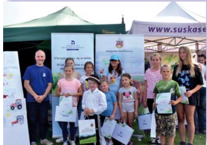
Laureaci konkursu plastycznego „Bezpiecznie pomagam w gospodarstwie”

W pierwszym dniu wystawy Małopolska Izba Rolnicza zorganizowała stoisko, na którym można było zaopatrzyć się w bezpłatną prasę rolniczą, ulotki, informatory oraz poradniki rolnicze. Ponadto, Małopolska Izba Rolnicza, wraz z Towarzystwem Ubezpieczeń Wza-