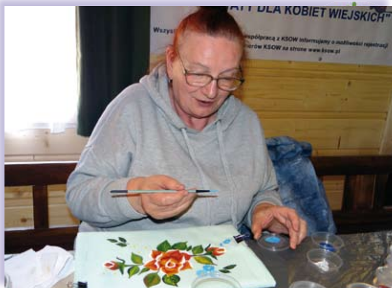
Warsztaty w Sidzinie, 11.05.2023 r.

Bardzo ważnym etapem był wybór materiału do malowania – powinien być tkany jak najciaśniej, dzięki czemu wszystkie malowane detale są widoczniejsze.