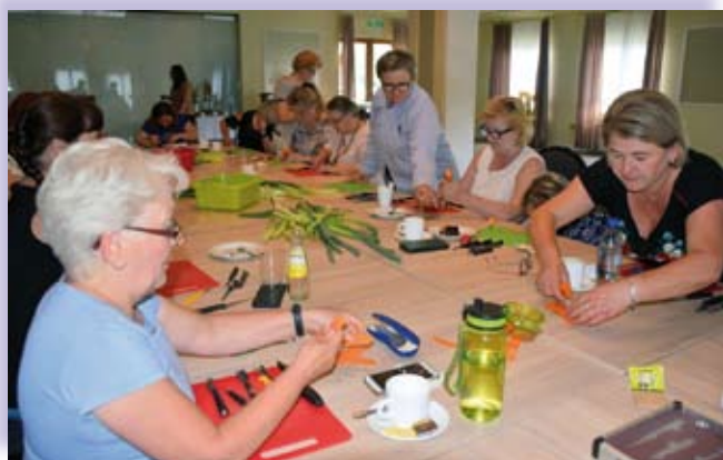
Warsztaty dla KGW z powiatu gorlickiego

Zajęcia warsztatowe dla KGW z powiatu tatrzańskiego odbyły się w dniu 22.06.2023 r. w Borowym Dworze w Bańskiej Niżnej, dla KGW z powiatu nowotarskiego – 26.06.2023 r. w ECO Active Resort Pieniny w Czorsztynie, dla KGW z powiatu limanowskiego – 28.06.2023 r. w Karczmie Gorczański Dworek w Porębie Wielkiej, dla KGW z powiatu nowosądeckiego – 30.06.2023 r. w Ośrodku Rekreacyjnym Ryterski w Rytrze, dla KGW z powiatu gorlickiego – 03.07.2023 r. w Gospodzie Margurskiej w Małastowie, dla KGW z powiatu tarnowskiego – 10.07.2023 r. w biurze Małopolskiej Izby Rolniczej w Tarnowie. Partnerami projektu było: Stowarzyszenie Lokalna Grupa Działania „Beskid Gorlicki” oraz Stowarzyszenie Lokalna Grupa Działania „Gorce-Pieniny”.