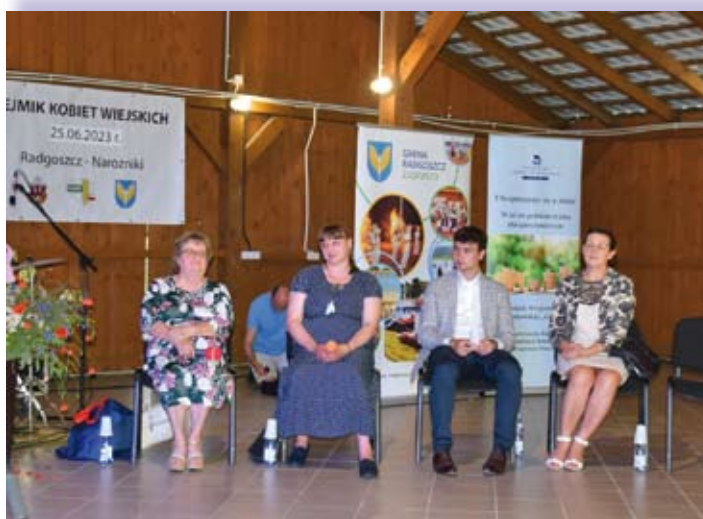
Uczestnicy panelu dyskusyjnego podczas II Sejmiku Kobiet Wiejskich