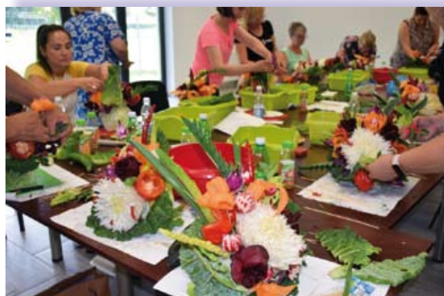
Warsztaty dla KGW z powiatu tarnowskiego

sposobów zabezpieczenia i pielęgnacji ozdób owocowo-warzywnych. Uczestniczki poznały zasady rzeźbienia w owocach i warzywach oraz zdobyły wiedzę o narzędziach przydatnych do carvingu, zapoznały się z prawidłowymi zasadami ich używania. Każda z uczestniczek otrzymała narzędzia oraz wszystkie materiały tj. warzywa i owoce konieczne do wykonania dekoracji metodą carvingu. Uczestniczki wykonały samodzielnie: kwiatki z rzodkiewek, kwiatki z marchwi, kwiat z plasterów czerwonego buraka, listki z pora, chryzantemę z kapusty pekińskiej, ażurowy liść z kapusty czerwonej, róże z cukinii, liście z cukinii, szyszkę z cebuli czerwonej, mak z papryki, kwiatki z papryczki chili (rozgwiazdę i szyszkę), szyszkę z marchwi, wzory w jabłku, nazwę koła gospodyń wiejskich w cukinii. Następnie z wykonanych dekoracji uczestniczki skomponowały bukiet na kapuście pekińskiej. Podczas zajęć warsztatowych instruktorka zwróciła uwagę na nowoczesne wzorce i techniki dekorowania potraw. Kobiety z KGW przygotowują regionalne potrawy na pokazach świątecznych stołów, konkursach potraw regionalnych, jarmarkach regionalnych, wystawach i festynach.