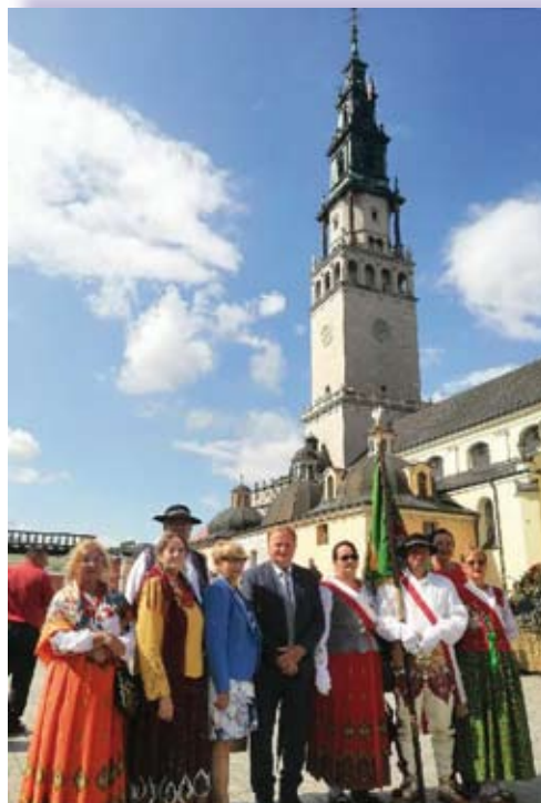
Delegacja MIR uczestnicząca w Dożynkach Jasnogórskich

Wieniec dożynkowy to najważniejszy dożynkowy atrybut. Do jego uwicia używa się najdorodniejszych zbóż, kwiatów, warzyw i owoców. Jego tradycyjny kształt nawiązuje do kształtu królewskiej korony. Kolejny bardzo ważny składnik dożynek to bochny chleba, uważane za kwintesencję wszystkich posiłków, boski dar zapewniający życie.