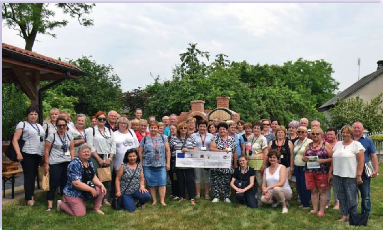
Wizyta w gospodarstwie w Korytnicy

Podczas wizyt rolnicy poszerzyli swoją wiedzę w temacie prowadzenia małego przetwórstwa w gospodarstwie oraz sprzedaży produktów przetworzonych w ramach rolniczego handlu detalicznego. Zapoznali się z możliwościami przetwarzania produktów z gospodarstwa w postaci: