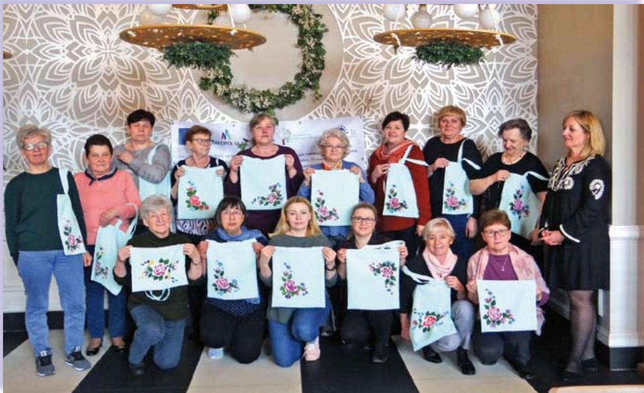
Uczestniczki warsztatów w Kętach, 20.04.2023 r.

farby do tkanin i pędzle, aby własnoręcznie ozdobić swoją niepowtarzalną torebkę.