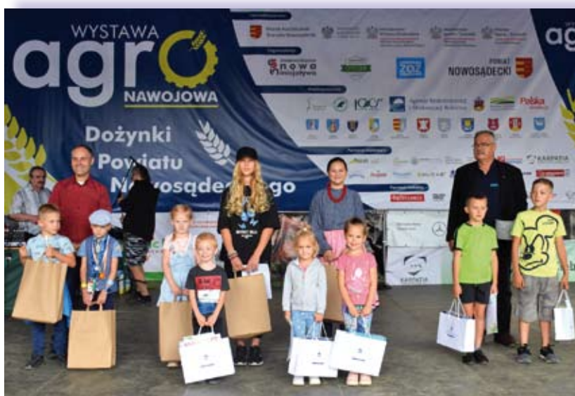
Laureaci konkursu plastycznego „Bezpiecznie pomagam w gospodarstwie”

W pierwszym dniu wystawy Małopolska Izba Rolnicza zorganizowała stoisko, na którym można było