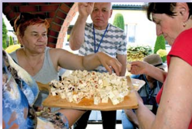
Degustacja serów w gospodarstwie w Głaniszewie