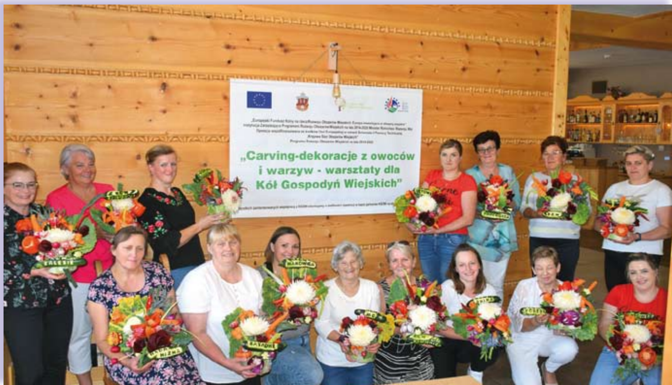
Uczestniczki warsztatów z powiatu limanowskiego

woju obszarów wiejskich, do rozwoju przedsiębiorczości na obszarach wiejskich pod kątem działalności pozarolniczej, dzięki której możliwa jest poprawa jakości życia i tworzenie nowych miejsc pracy na obszarach wiejskich. Uczestniczki warsztatów będą przekazywać zdobyte umiejętności pozostałym członkiniom w swoich kołach.