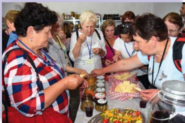
Degustacja w gospodarstwie w Balkowie