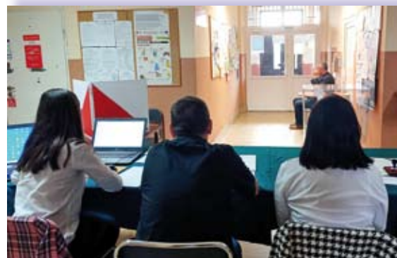
Lokal wyborczy i wybory w Kozłowie

w Łapanowie (pow. bocheński), w Raclawicach i w Kozłowie (pow. miechowski). Lokale wyborcze czynne były w godzinach od 8:00 do 18:00.